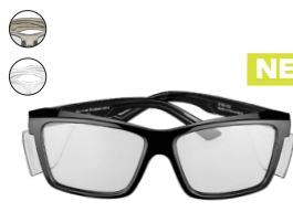
STKS 420 | DIE GRUNDLEGENDE KURVE 4 1 GRÖSSE