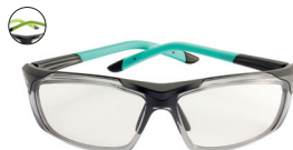
HARPER | DIE UMHÜLLUNGEN KURVE 8 1 GRÖSSE 2 FARBEN