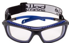
BAXTER | DIE HYBRIDEN KURVE 8 1 GRÖSSE